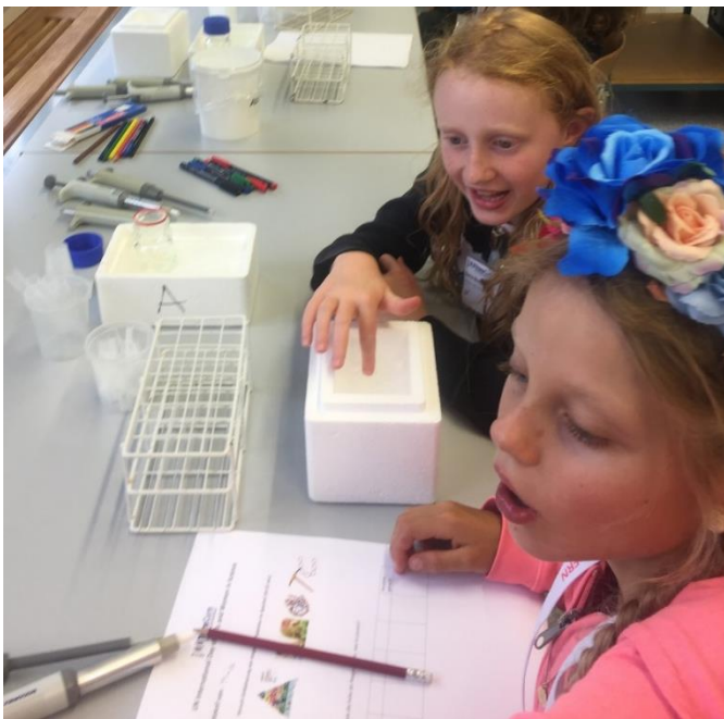
Begeisterung beim Amylase Versuch.